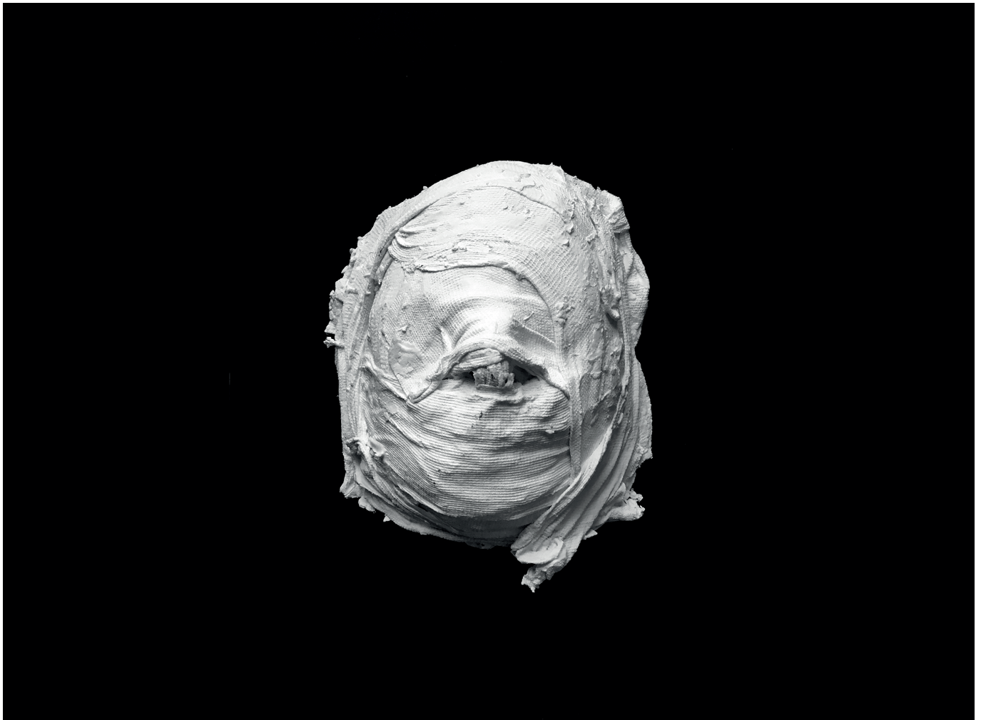
© «ANIMACIES», Julie Ramage/Section des Étudiants Empêchés