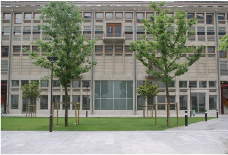
Vue de la façade de Bétonsalon

Bétonsalon est une association de loi 1901 qui gère un centre d'art et de recherche situé dans une université, au cœur d'un quartier en reconstruction, appelé ZAC Paris Rive Gauche, à la périphérie nord-est du 13 ème arrondissement de Paris, à deux pas de la Seine et de Ivry sur Seine.