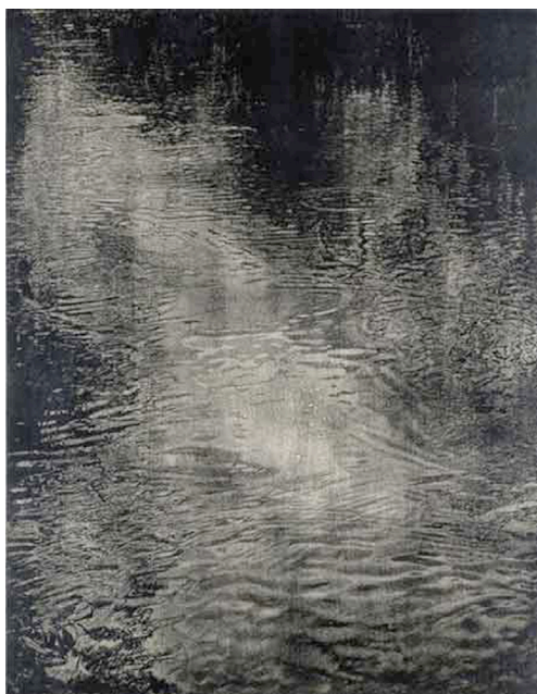
Franz Gertsch, Schwarzwasser I , 1990/91 Xylographie, H 276 cm x L 217 cm Collection Musée Franz Gertsch