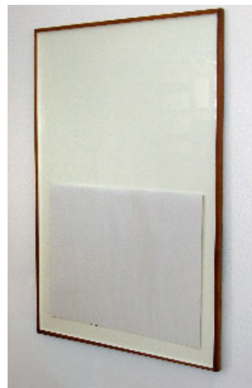
Nina Beier et Marie Lund, The Archives (World Peace) , 2008 Cadres, affiches d'occasions, dimensions variables, 2008 The Archives (Pour la solidarité anti-impérialiste, pour la paix et l'amitié) 2008 The Archives (Nach dem nächsten krieg wird kein kind mehr spielen) 2008