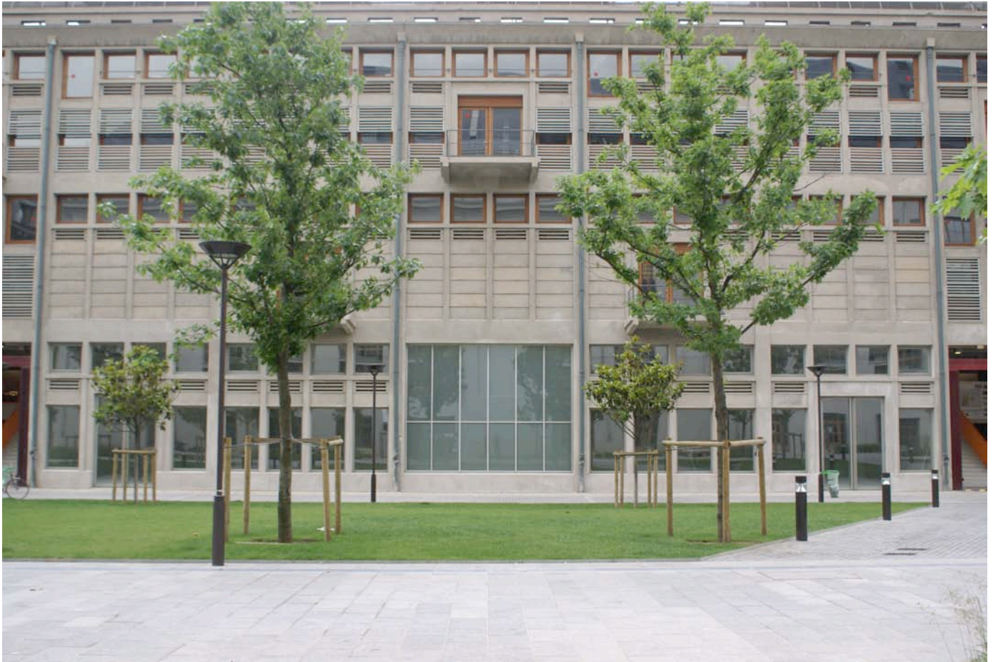
Vue de la façade de Bétonsalon