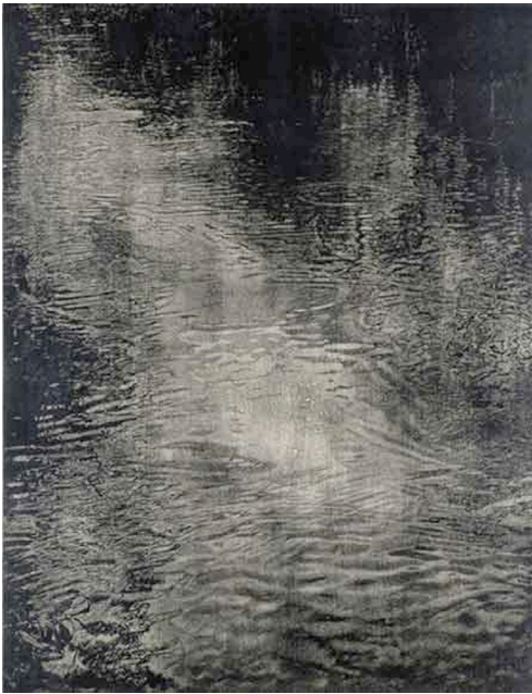
Franz Gertsch, Schwarzwasser I , 1990/91 Xylography, 276 x 217 cm Collection Franz Gertsch Museum