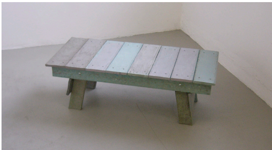
Dan Peterman, Accessories to an event , 1996 Pallets, tables made out of recycled plastic 37 x 110 x 50 cm