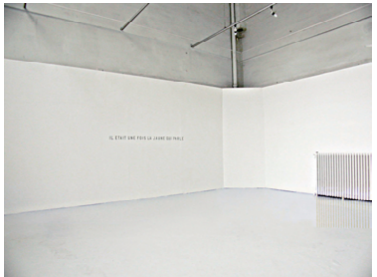
La jaune qui parle - 2003 Espace vide, inscription au crayon à papier gras sur mur blanc. Une lecture a eu lieu