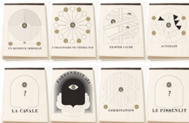
Maquette de l'identité visuelle par Chi Wai Ng