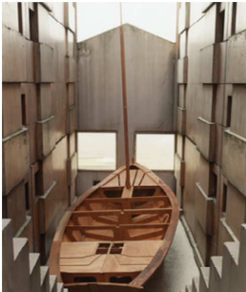
La barque du Palacio - 2007 Bois okoumé et sipo - 3.20 x 6.90 x 8.40 m Installation sur le toit de l'architecture en béton de Ricardo Bofill dit le Palacio d'AbraXas , Noisy-le-Grand, Ville Nouvelle de Marne-la-Vallée