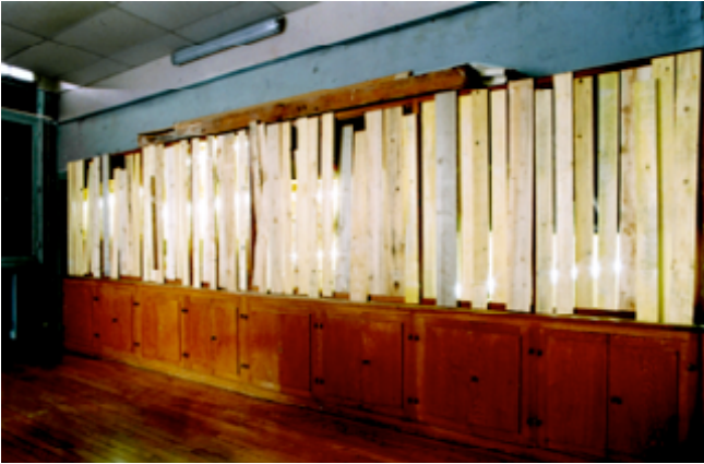
Exister caché , première version, bibliothèque, livres, néon, bois

[katsāsēkātēcē dāgrē fæcænhait ræpræzāt la tāperatyr a lakel cē livr sāflam e sō kōsym]