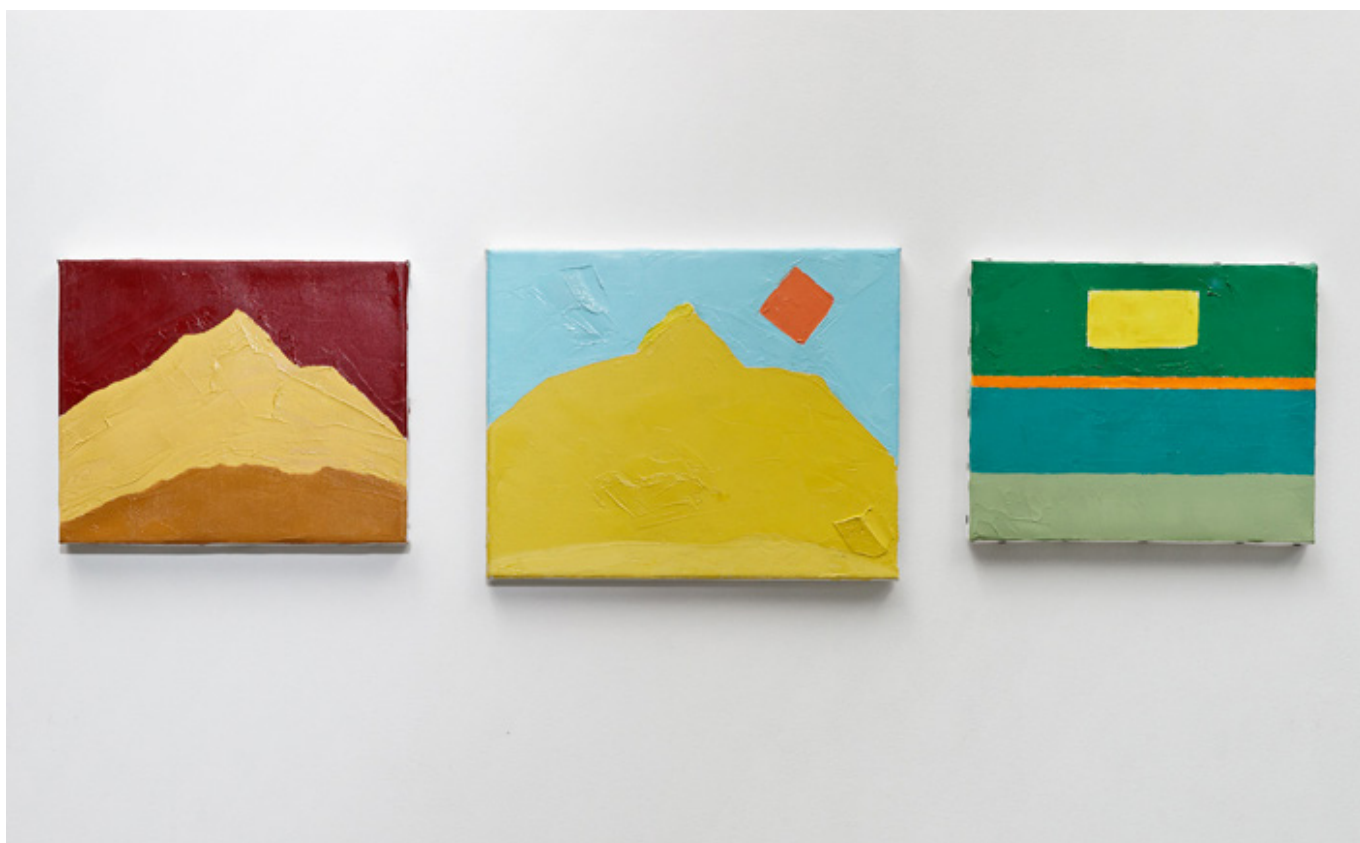
Vue de l'exposition De Menocchio, nous savons beaucoup de choses . avec Etel Adnan, Sans titre , 2010, huile sur toiles. Bétonsalon - Centre d'art et de recherche, Paris, 2012. Image © Aurélien Mole. Avec l'aimable autorisation d'Etel Adnan & Sfeir-Semler Gallery, Beyrouth-Hambourg.