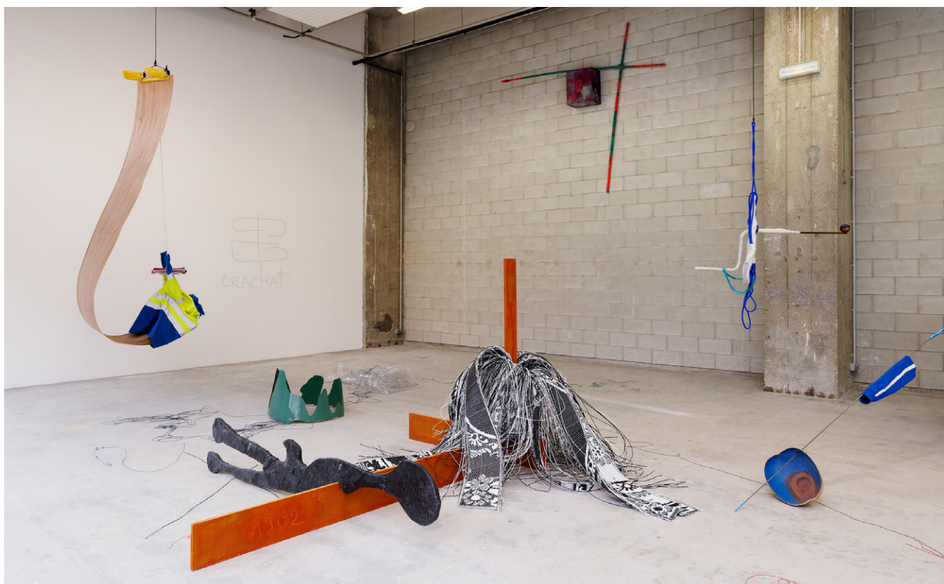
Vue de l'exposition de Julien Creuzet, La pluie a rendu cela possible (...) à Bétonsalon - Centre d'art et de recherche, Paris, 2018.