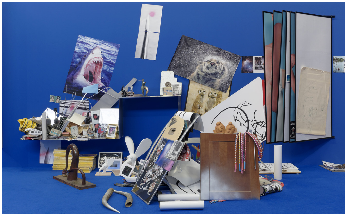
Vue de l'exposition de Camille Henrot, The Pale Fox . Bétonsalon - Centre d'art et de recherche, Paris, 2014.