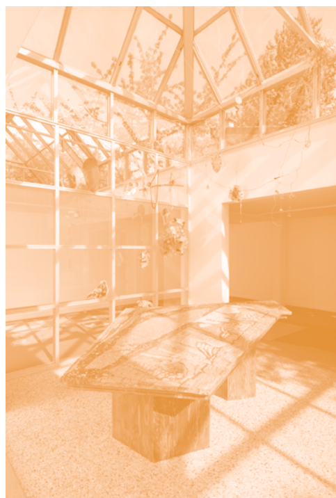
ÈVE CHABANON AVEC ABOU DUBAEV, THE SURPLUS OF THE NON-PRODUCER , 2018 PRODUITE PAR / PRODUCED BY LAFAYETTE ANTICIPATIONS, PARIS VUE DE L'EXPOSITION / EXHIBITION VIEW, TAKE (A)BACK THE ECONOMY, CAC CHANOT, CLAMART, 2019

À l'hiver 2019, la première partie du film Le surplus du non-producteur est tournée au lycée Julie-Victoire Daubié à Argenteuil ; les non-producteur·rice·s y présentent leurs parcours et invitent les élèves à prendre part à des ateliers qui les initient à leurs domaines de compétences : chant, graphisme, improvisation théâtrale, cinéma. Cette matière doit être complétée par une seconde partie fictionnelle, écrite, réalisée et incarnée par les non-producteur·rice·s, qui n'a pas encore été tournée. Qu'à cela ne tienne : de courts extraits des rushes filmés sont présentés sur des écrans dans l'exposition. Ces saynètes constituent des tableaux vivants qui documentent les formes antérieures du projet d'Ève Chabanon et matérialisent par des moments de partage, de mécompréhension et d'émotion les présences des non-producteur·rice·s.