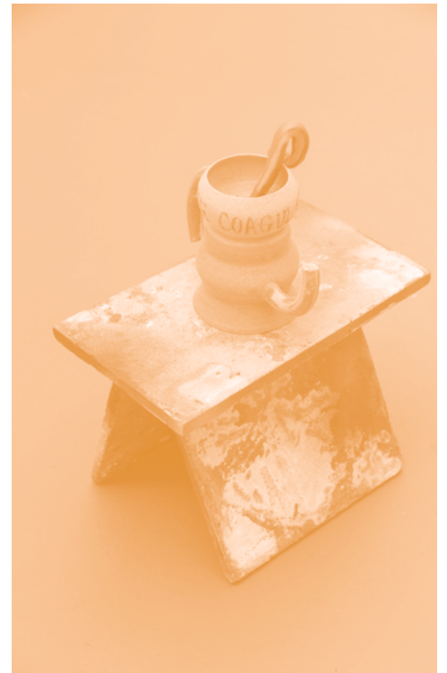
ÈVE CHABANON, EATING EACH OTHER , THE ENGINE ROOM, WELLINGTON, NOUVELLE- ZÉLANDE / NEW ZEALAND, 2019